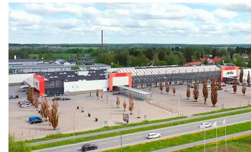
Sedu Seinäjoki, Suupohjantie 2020