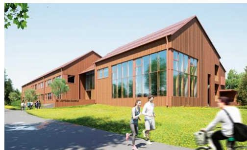
Sedu Ähtäri, Ähtärin kampus 2025