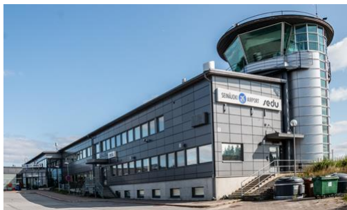
Sedu Rengonharju 2018