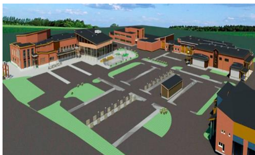
Sedu Seinäjoki, Törnäväntie 2024