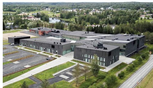
Sedu Kurikka, Kurikan kampus 2019