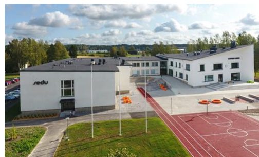
Sedu Lapua 2022