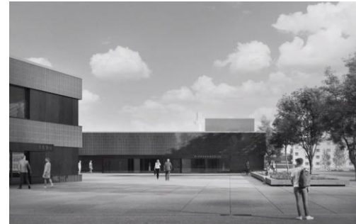
Sedu Seinäjoki, Kirkkokatu vuosi 2028