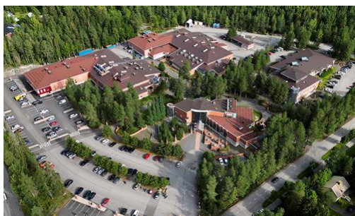
Sedu Seinäjoki, Rastaantaival 2020